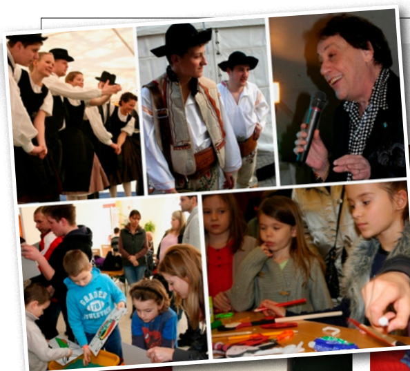
Pilisska kavalkáda a šiškový festival