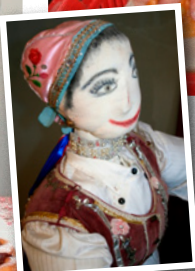
Nemzetközi fánkfesztivál Pilisszentkereszten