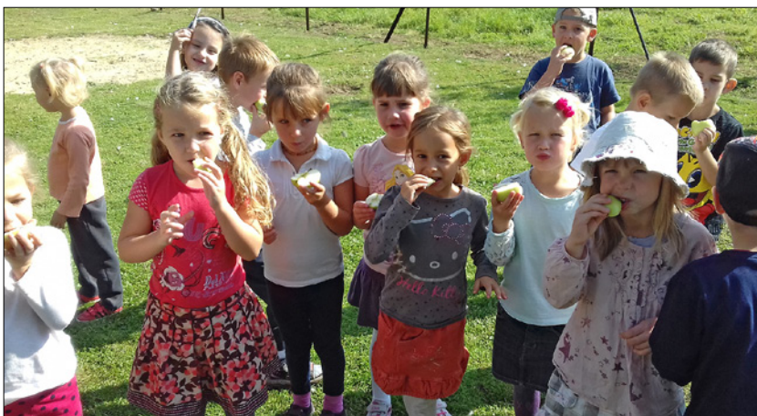
Ovisaink az Almahétén