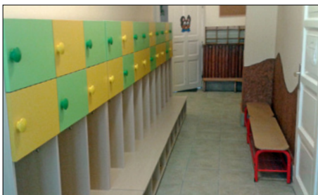
A felújított folyosó az új öltözőszekrényekkel

A Mikulást december 6-án (kedden) várjuk az óvodába. A kézműves délutánnal egybekötött „Adventi vásár” december 9-én kerül megrendezésre, amelyre minden érdeklődőt szeretettel várunk!