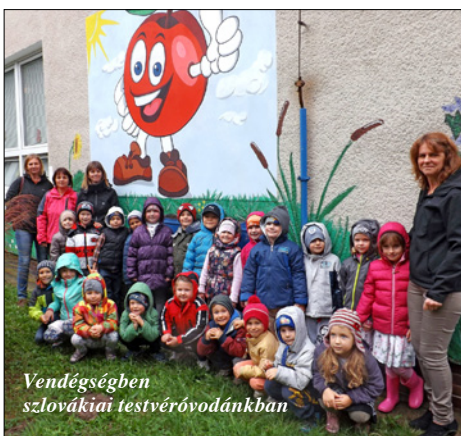
Vendégségben szlovákiai testvéróvodánkban