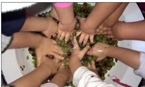
Must készül kézi préseléssel a Skanzenben