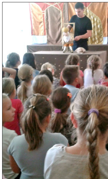
A lelkes hallgatóság a bábeloadáson