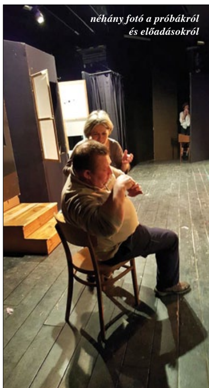
néhány fotó a próbákról és előadásokról