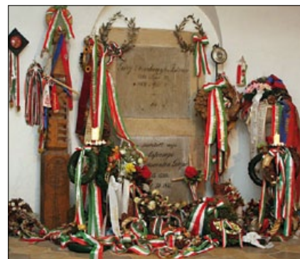
Széchenyi István végső nyughelye Nagycenken

Nem hal meg az, ki milliókra költi Dús élte kincsét, ámbár napja múlt; Hanem lerázván, ami benne földi, Egy éltető eszmévé fínomul, Mely fennmarad s nőtön nő tiszta fénye, Amint időben, térben távozik; Melyhez tekint fel az utód erőnye: Óhajt, remél, hisz és imádkozik.