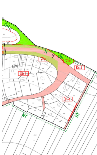
Jelenleg hatályos SZT-3 tervlap

hagyja jóvá a képviselő testület a korábbi döntés szabályozási tervlapon történő módosítását.